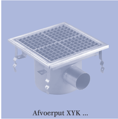
Afvoerput XYK ...

Type XYK-30 (□300 mm), XYK-40 (□400 mm), Type XYK-30A (□300mm), XYK-40A (□400mm)