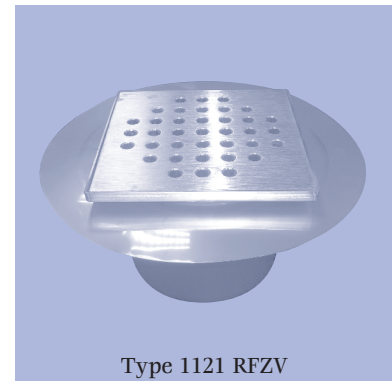
Type 1121 RFZV