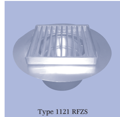
Type 1121 RFZS