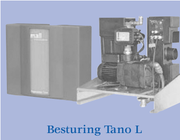
Besturing Tano L

NeBo regenwatergebruik systeem, geschikt voor gebruik van regenwater voor bijvoorbeeld toiletspoeling, tuin beregening of ander gebruik zijnde niet drinkwater. Leverbaar met een maximale capaciteit tot 5m 3 /u. Het systeem bestaat uit een buffer/filtertank van monolithisch gewapend beton, voorzien van gietijzeren afdekking met verkeersklasse A 15KN volgens NEN-EN-124, en een separaat zelf aanzuigend besturingssysteem. Het systeem dient voor een gegarandeerde waterlevering en zelfstandige reiniging te worden aangesloten op het drinkwaternet. Het systeem wordt geleverd met een compleet aansluitset en is onderhoudsarm. Levering conform NEN-EN-ISO 9001.