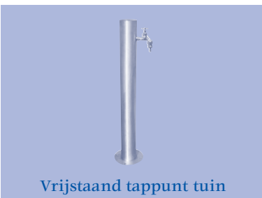
Vrijstaand tappunt tuin