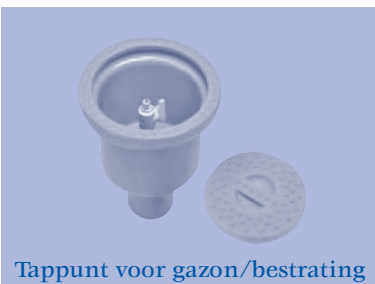
Tappunt voor gazon/bestrating