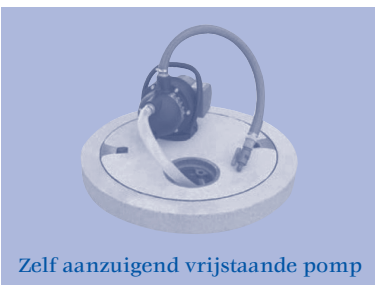
Zelf aanzuigend vrijstaande pomp